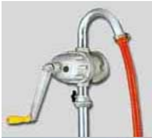
HP-1000B (รุ่นข้อโค้ง)